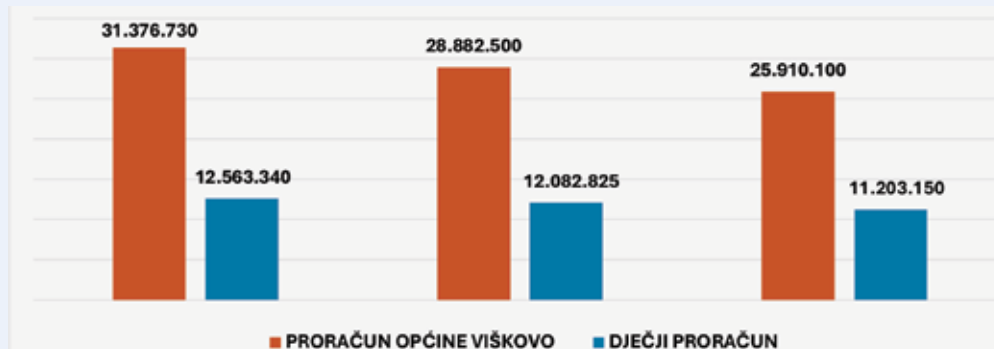
Grafikon br. 1. Dječji proračun i proračun Općine Viškovo 2026. – 2028. godine

Istodobno, tijekom cijelog planskog razdoblja osigurano je stabilno financiranje redovitih programa i aktivnosti iz područja predškolskog odgoja i obrazovanja: sufinanciranje boravka djece u vrtićima, sufinanciranje produženog boravka u školama, besplatnog javnog prijevoza za osnovnoškolce i srednjoškolce, financiranje programa klubova koji djeluju u okviru Zajednice sportskih udruga Općine Viškovo, brojnih kulturnih programa za djecu i mlade koje provode Knjižnica i čitaonica „Halubajska zora“ te Javna ustanova u kulturi Kuća halubajškoga zvončara kao i programa odnosno mjera iz socijalne i zdravstvene skrbi poput: naknada za novorođenu djecu, usluga logopeda, rehabilitatora, psihologa i socijalnog pedagoga za djecu s posebnim potrebama, a čime se jamči kontinuitet kvalitete usluga i sadržaja nami-