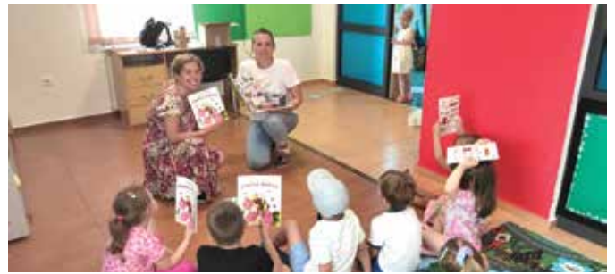
DV Pčelica Ančica darovana – Pčelica Ančica

Kod nadarene djece potiče kreativnost, emocionalnu ravnotežu i pomaže u prevladavanju preopterećenosti izazvane pojačanim osjetima ili mentalnim naporom.