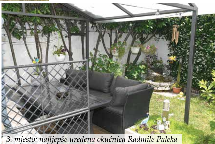
3. mjesto: najljepše uređena okućnica Radmile Paleka