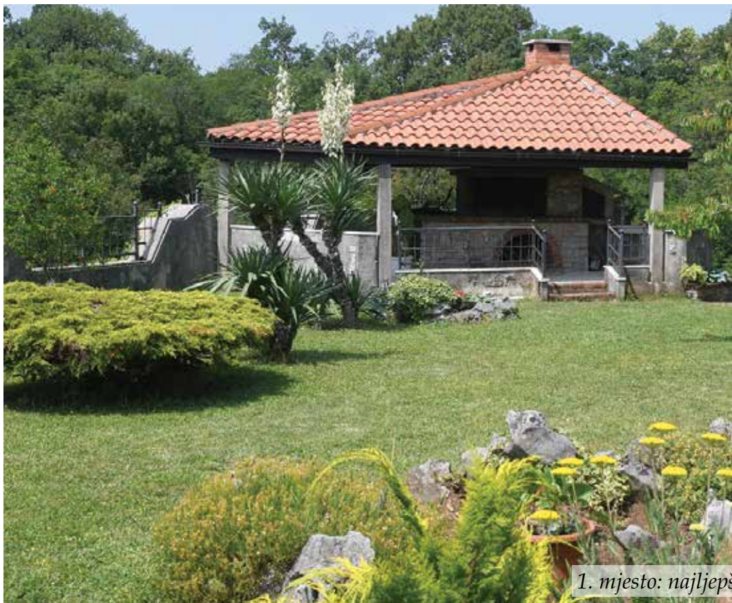
1. mjesto: najljepše uređenje

Čestitamo svim nagrađenima na njihovoj predanosti uređenju svojih balkona i okućnica. Koristimo priliku pozvati sve mještane da i sljedeće godine kroz prijavu na natječaj podijele s nama svoja krajobrazna uređenja.