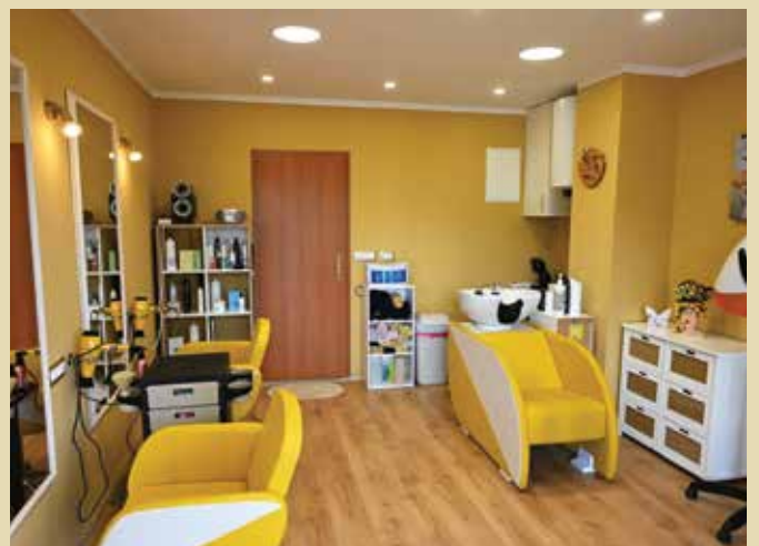
Dobrodošli u frizerski salon Adry Vršak 2, Marčelji Mob: 0916159223

Prilikom prvog dolaska klijenti ostvaruju pravo na besplatne konzultacije, a sve informacije o uslugama i pogodnostima moguće je pratiti putem Facebook i Instagram stranica salona.