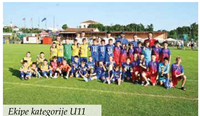
Ekipe kategorije U11