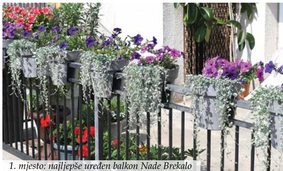
1. mjesto: najljepše uređen balkon Nade Brekalo