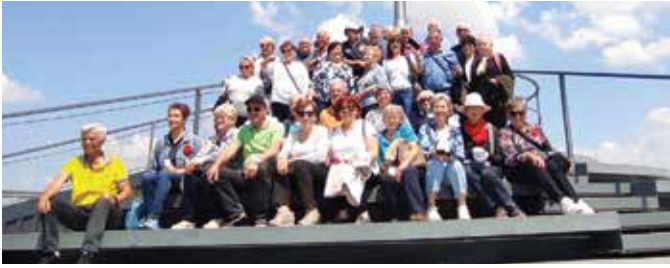
UDRUGA ANTIFAŠISTIČKIH BORACA I ANTIFAŠISTA OPĆINE VIŠKOVO