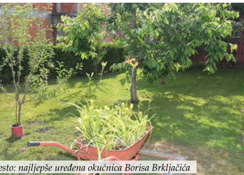
esto: najljepše uređena okućnica Borisa Brkljačića

Turistička zajednica općine Viškovo i ove godine je organizirala Natječaj za najljepše uređenu okućnicu i balkon na području općine Viškovo za 2025. godinu. Obilazak prijavljenih objekata još je jednom potvrdio kako Viškovo ima vrijedne i kreativne mještane koji s puno ljubavi uređuju svoje vrtove, okućnice i balkone. Njihov trud pretvorio je vanjske prostore u prave male oaze za opuštanje i uživanje. Natječaj je trajao od travnja do svibnja, a na njega se prijavilo jedanaest sudionika. U lipnju stručno povjerenstvo obišlo je i ocijenilo hortikulturno uređenje, opremljenost i funkciju u prostoru te na temelju ukupne ocjene izabralo pobjednike kako slijedi: