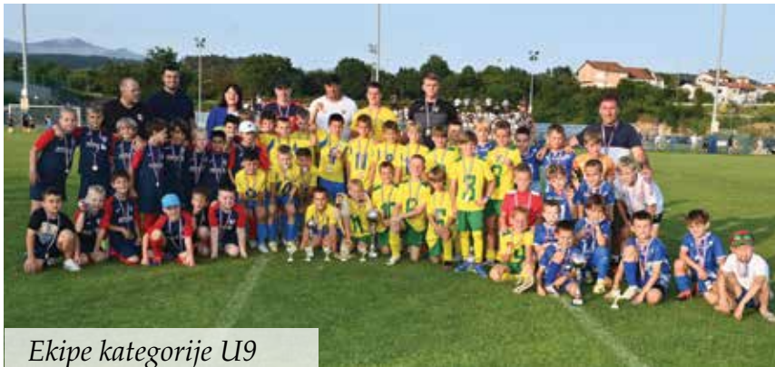
Ekipe kategorije U9