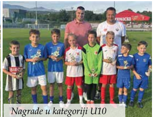
Nagrade u kategoriji U10