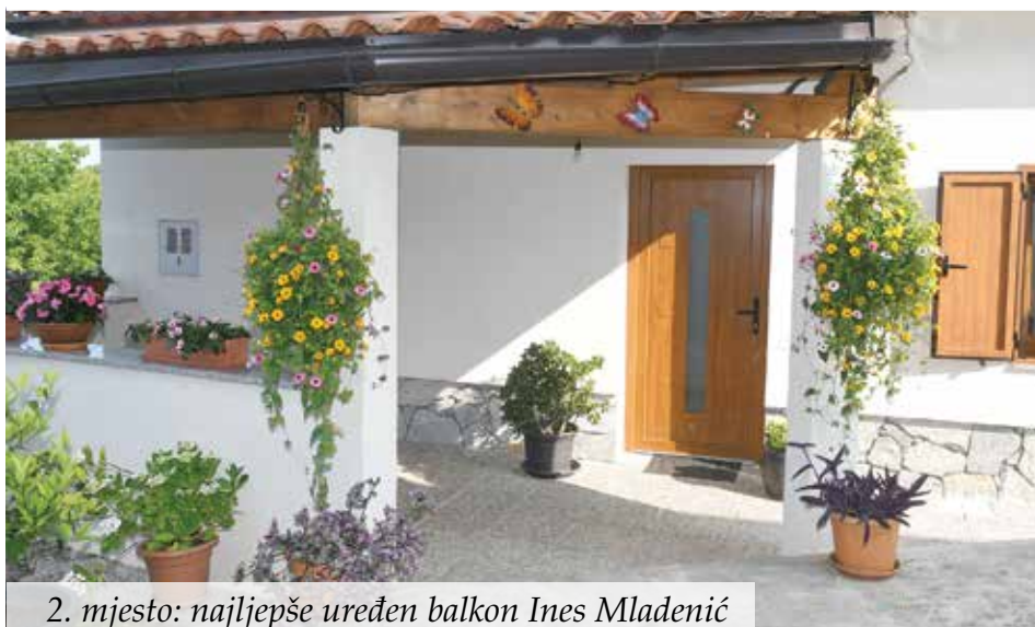
2. mjesto: najljepše uređen balkon Ines Mladenić