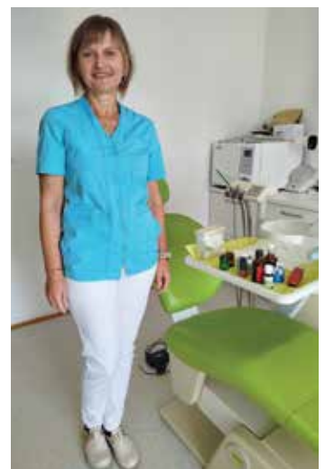
VAŠ OSMIJEH – NAŠA BRIGA!

Prijaviti se možete slanjem svojih podataka putem web formulara na naslovnoj stranici ordinacije: https://stomatoloska-ordinacija-rijeka.com/